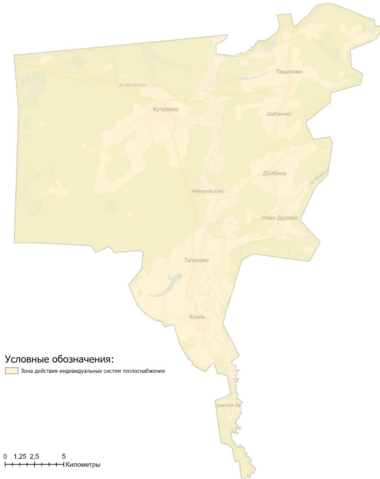
Рисунок 2.2.1 - Зоны действия видов теплоснабжения на территории муниципального образования Купреевское (сельское поселение)