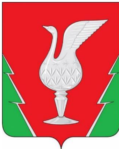
СХЕМА ТЕПЛОСНАБЖЕНИЯ МУНИЦИПАЛЬНОГО ОБРАЗОВАНИЯ ПОС. ВЕЛИКОДВОРСКИЙ (СЕЛЬСКОЕ ПОСЕЛЕНИЕ) ГУСЬ-ХРУСТАЛЬНОГО РАЙОНА ВЛАДИМИРСКОЙ ОБЛАСТИ ДО 2030 ГОДА (АКТУАЛИЗАЦИЯ ПО СОСТОЯНИЮ НА 2025 ГОД)