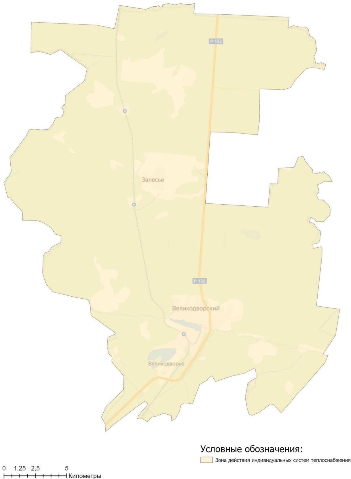
Рисунок 2.2.1 - Зоны действия видов теплоснабжения на территории муниципального образования пос. Великодворский (сельское поселение)