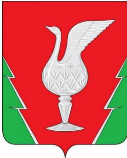
СХЕМА ТЕПЛОСНАБЖЕНИЯ МУНИЦИПАЛЬНОГО ОБРАЗОВАНИЯ ПОС. КРАСНОЕ ЭХО (СЕЛЬСКОЕ ПОСЕЛЕНИЕ) ГУСЬ-ХРУСТАЛЬНОГО РАЙОНА ВЛАДИМИРСКОЙ ОБЛАСТИ ДО 2027 ГОДА (АКТУАЛИЗАЦИЯ ПО СОСТОЯНИЮ НА 2024 ГОД)